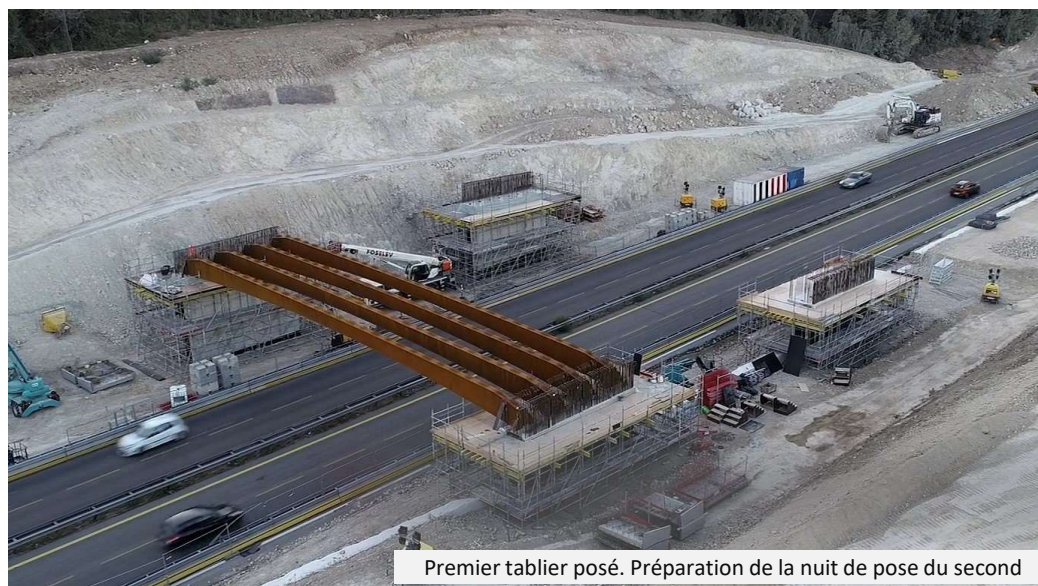
Premier tablier posé. Préparation de la nuit de pose du second