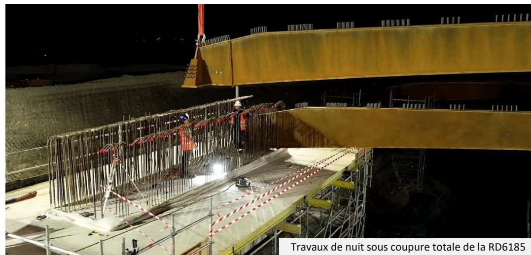
Travaux de nuit sous coupure totale de la RD6185